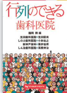
高橋伸治氏執筆 行列のできる歯科医院 2003年11月発行 デンタルダイヤモンド社

定期健診受診者数が1年で1万人を超える。開業以来一度も売り上げ減がない「予防歯科」のカリスマ。